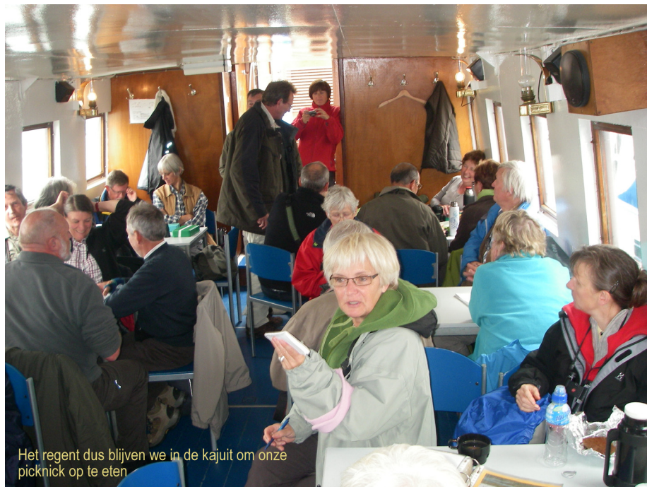
Het regent dus blijven we in de kajuit om onze picknick op te eten

Tussen de buitjes door klimmen we op het dek en volgen we de rondvaart van het Oostelijk Waddengebied: visdief, noordse stern, grote stern en dwergstern zijn de vier soorten